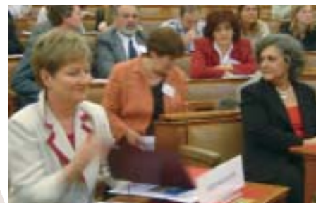
Katalin Szili, President of the Hungarian Parliament and Kinga Góncz, Minister for equal Opportunities.

La reconnaissance de l'importance de la conférence et de son thème était telle que c'est le bâtiment du Parlement hongrois qui a accueilli la conférence. Le magnifique environnement des lieux a permis d'attirer l'intérêt de la presse et des médias hongrois et de favoriser la prise de conscience du public sur la question de la prévention du sans-abrisme. La conférence a été